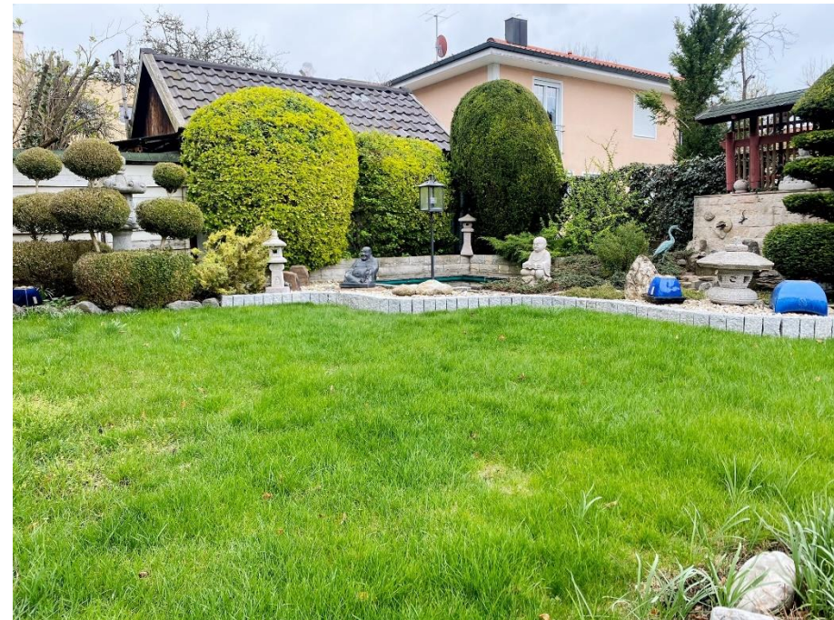
Wintergarten und Garten