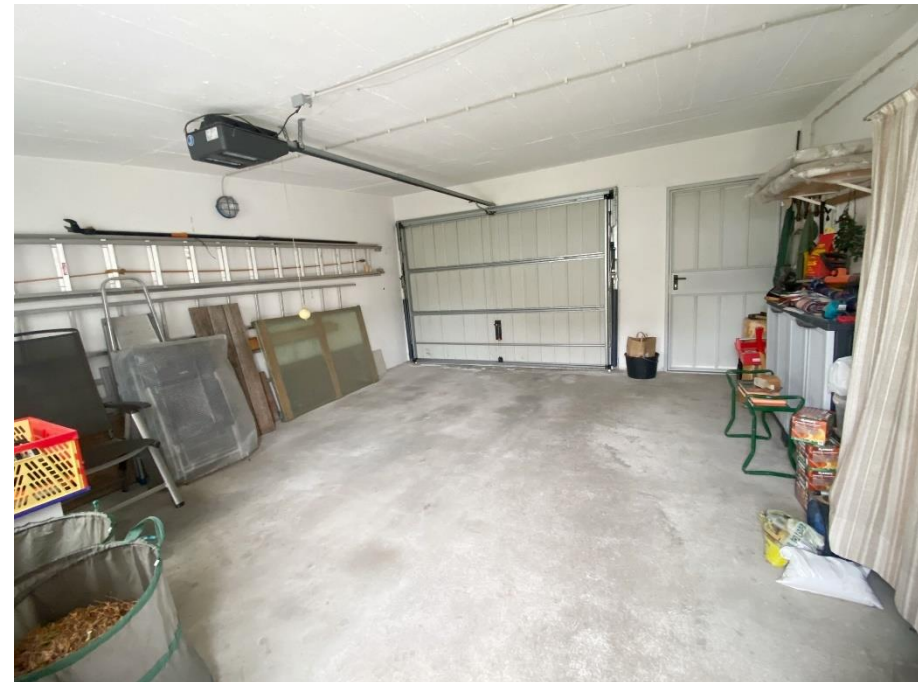
Garten und Garage