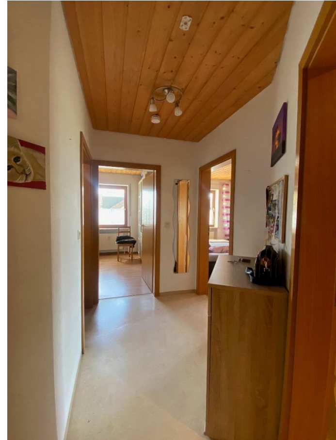
Badezimmer und Flur