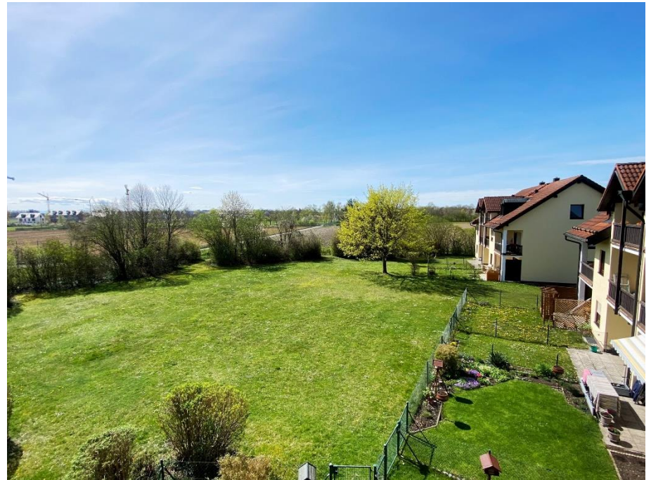
Balkon und Ausblick