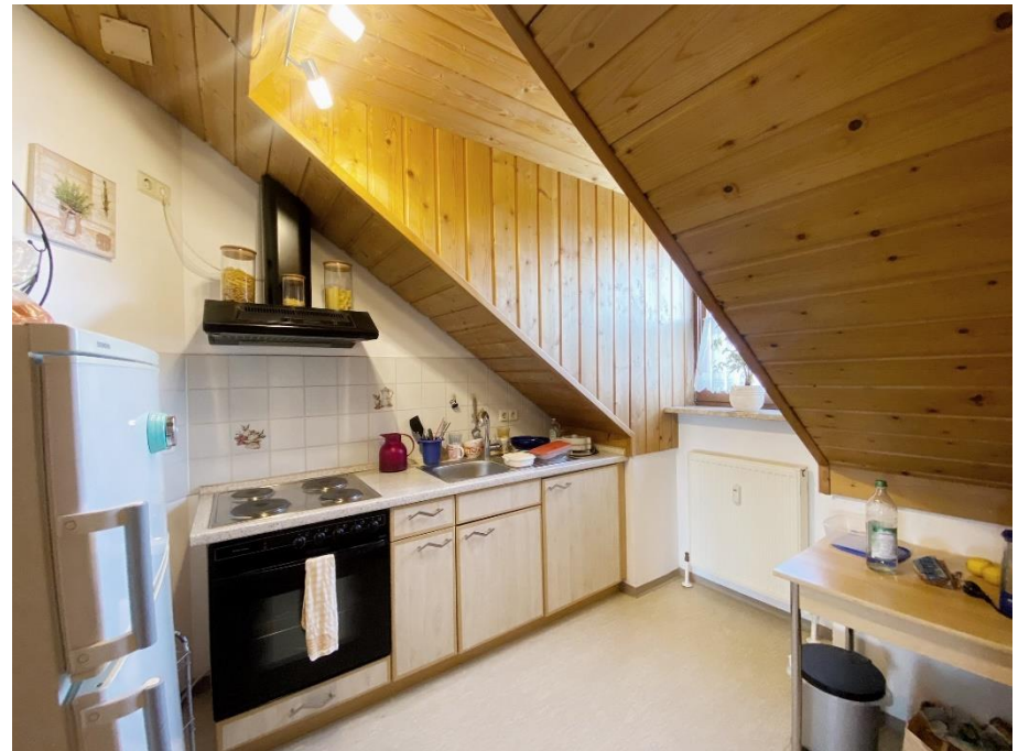
Schlafzimmer und Küche