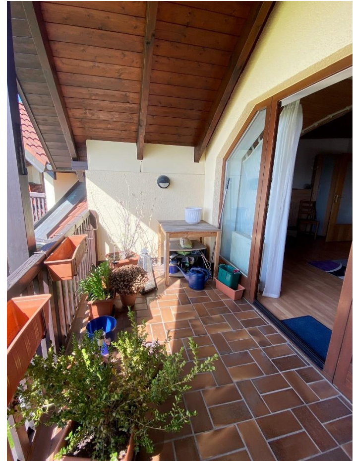
Wohnzimmer und Balkon